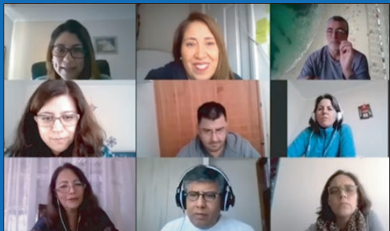
Sesión virtual con experta en herramientas TIC.