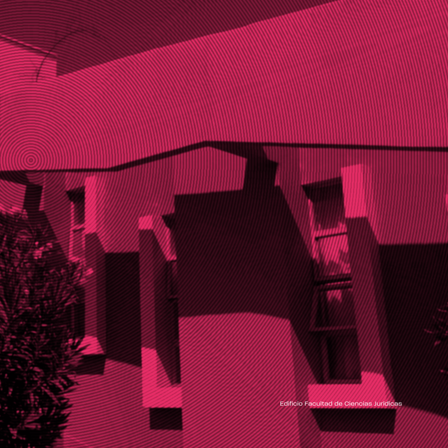
Edificio Facultad de Ciencias Jurídicas